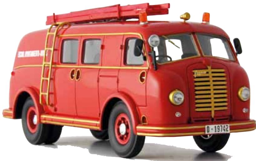
Pegaso van Autocult.