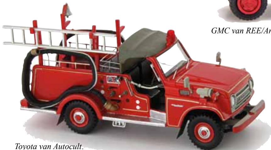
Toyota van Autocult.