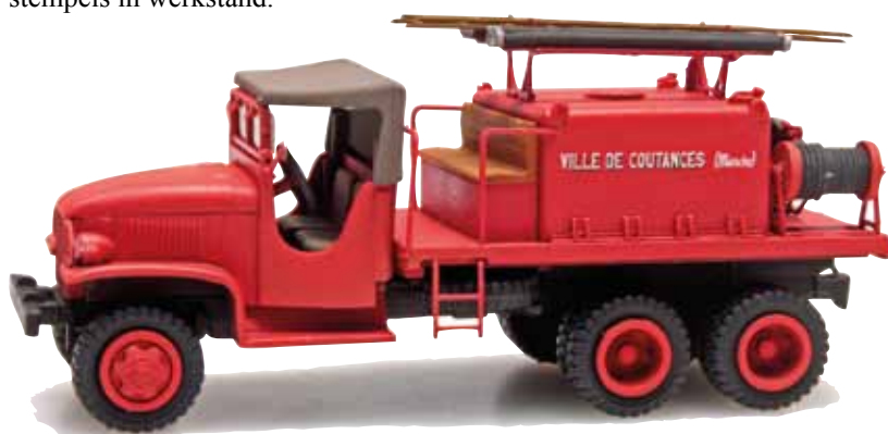
GMC van REE/Artitec.

Door nieuwe technieken kunnen in kleine oplages fraaie modellen gemaakt worden. Het daarvoor gebruikte materiaal is 'resin', ook wel aangeduid als giethars. Een vloeibaar te verwerken kunststof die in combinatie met mallen uit eenvoudig materiaal, of met 3D-printers gebruikt wordt. Dit in tegenstelling tot de productie uit kunststof of metaal met dure spuitgietsmachines en de bijbehorende kostbare stalen mallen. De hierbij noodzakelijke grote hoeveelheid verkochte modellen kan voor veel modellen niet (meer) gerealiseerd worden.