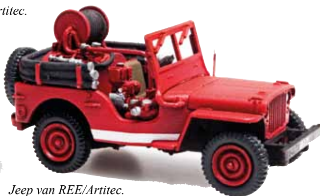
Jeep van REE/Artitec.