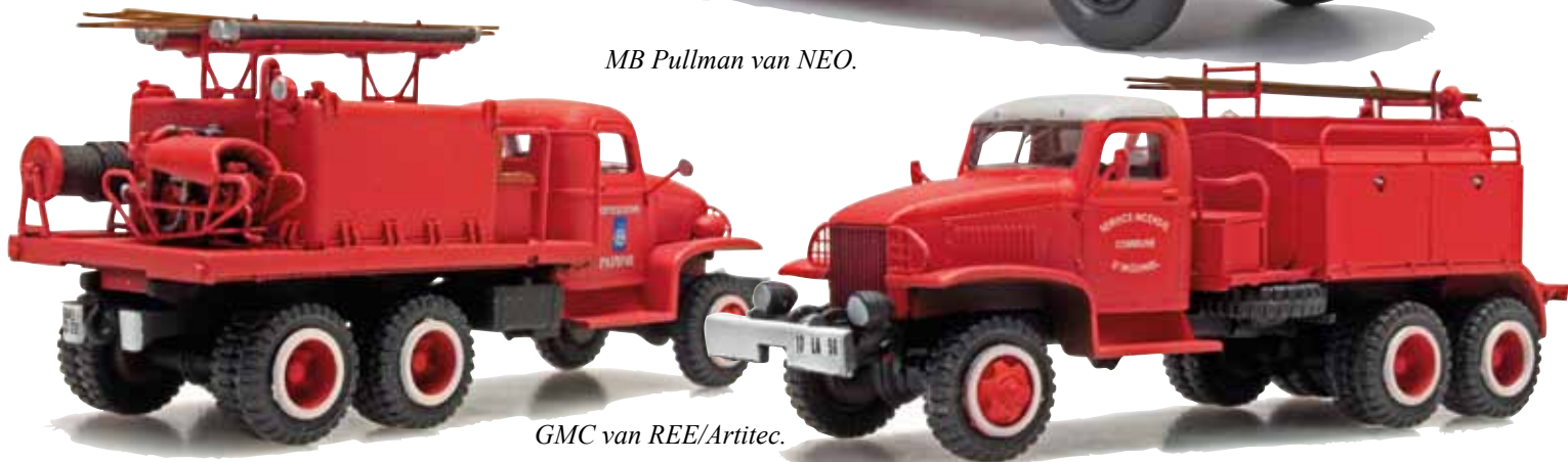
GMC van REE/Artitec.