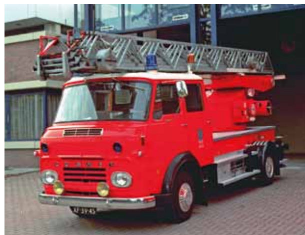
Boven: de autoladder van Brekina en de Oostduitse autoladder van Bussum in 1/1.

Gedurende vele jaren brachten wij u na de jaarlijkse speelgoed- en modellenbeurs in Neurenberg een overzicht van wat er in de loop van het jaar op brandweergebied te verwachten was voor de verzamelaars en modelbouwers. Deze keer tonen wij u een aantal highlights. En vertellen waar mogelijk wat meer over model en/of voorbeeld.